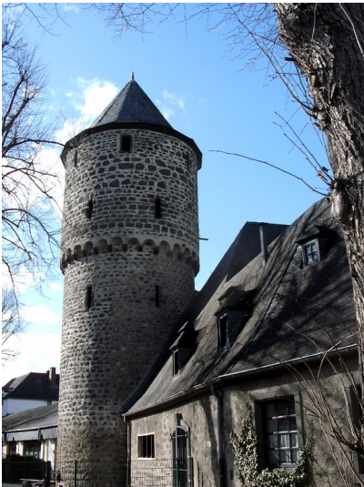
Der Vogelsturm in der Mayener St.-Veit-Straße ist ein erhaltener Rest der früheren Stadtbefestigung (2013).