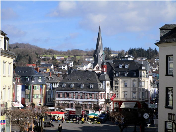
Blick über den Marktplatz in Mayen: zentral das Alte Rathaus, recht davon das historische Kaufhaus und dahinter der gedrehte Turm der Clemenskirche (2015).