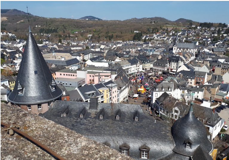
Blick über die Stadt Mayen mit Marktplatz, altem Rathaus und St.-Clemens-Kirche vom Goloturm der Genovevaburg aus (2019).