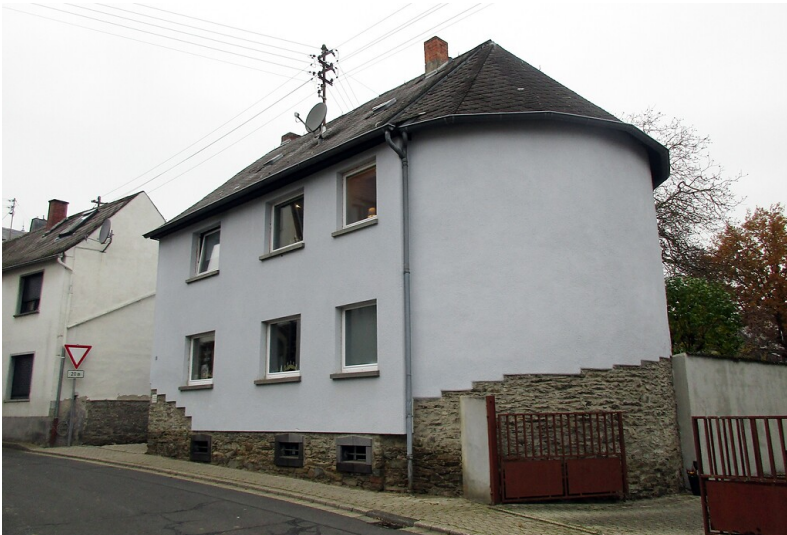
Das einstige Synagogengebäude in Mertloch, das heute nach einem Umbau als Wohnhaus genutzt wird (2022).