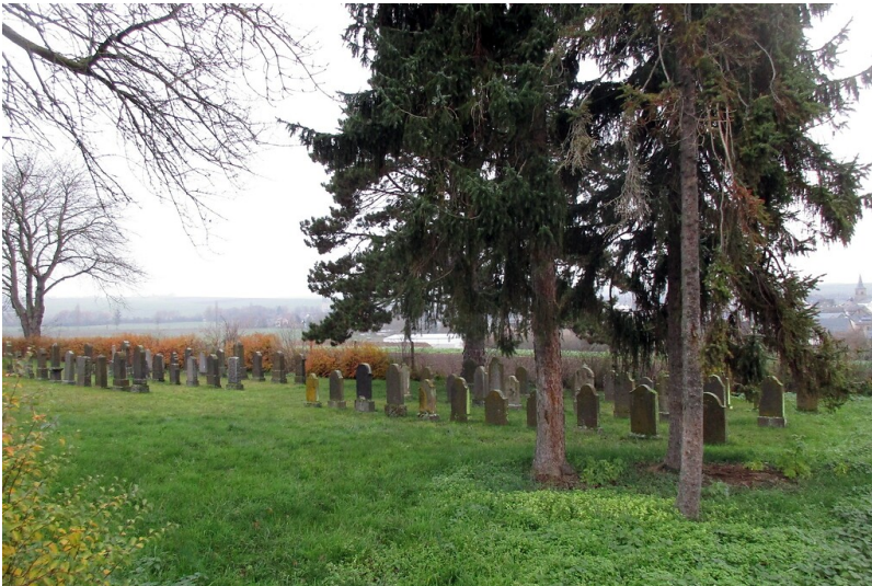
Blick über das Gräberfeld des südlich des Orts gelegenen jüdischen Friedhofs Mertloch (2022).