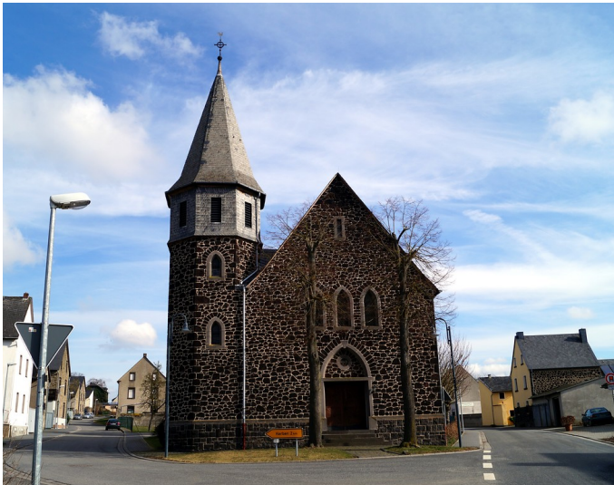
Katholische Filialkirche Christ König in Polch-Kaan, Frontansicht (2015)