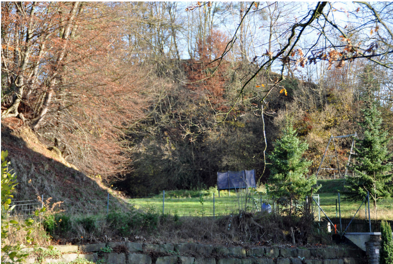
Herrenstrunden, Ehemaliger Steinbruch Rosenthaler Weg (2014)