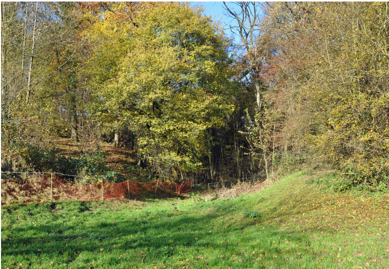
Romaney, ehemaliger Kalksteinbruch Büchel (2014)