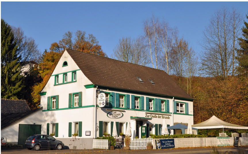
Herrenstrunden, Gaststätte Richerzhagen (2014)