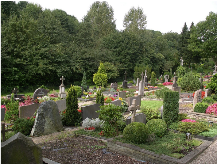
Friedhof Herrenstrunden