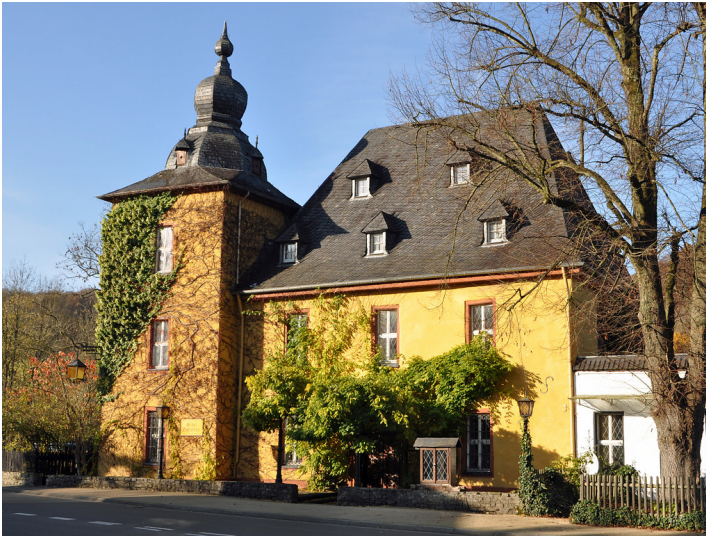
Herrenstrunden, Burg Zweifel (2014)