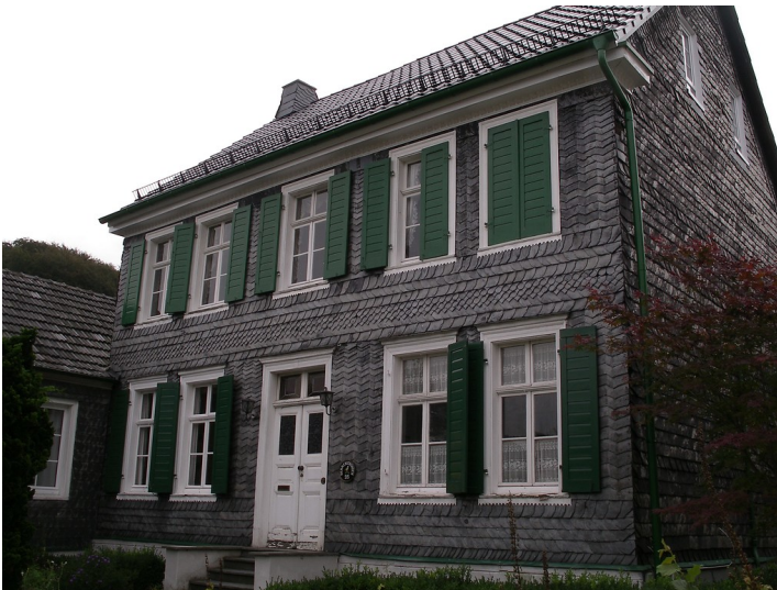
Das Alte Pfarrhaus in Herrenstrunden (2004)