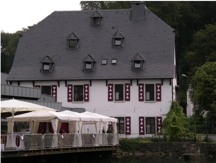
Malteserkomturei in Herrenstrunden