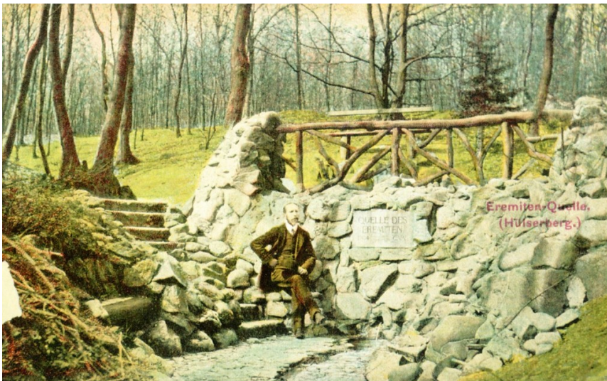
Historische Postkarte von um 1900 der Eremitenquelle am Hülser Berg bei Krefeld.