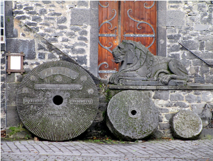
Deutsches Vulkanmuseum „Lava-Dome“ in Mendig, Mülhsteine im Innenhof zum Lavakeller (2015).