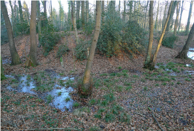
Motte Schwanenmühle im Wald bei Langenfeld-Wiescheid (2014)