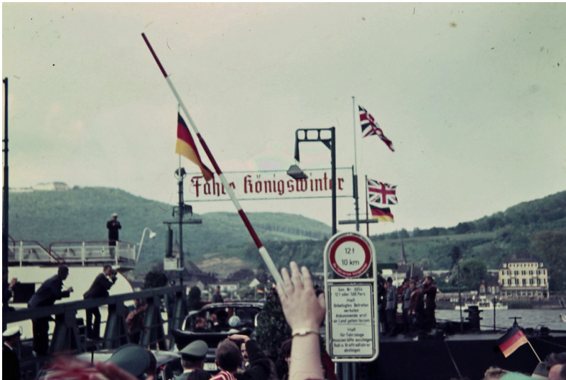
Staatsbesuch von Queen Elizabeth II. im Mai 1965: auf der Rheinfähre nach Königswinter.