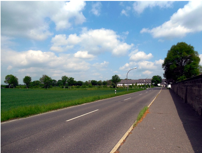
Die Eiler Straße südlich von Heumar in Blickrichtung Norden (2015)