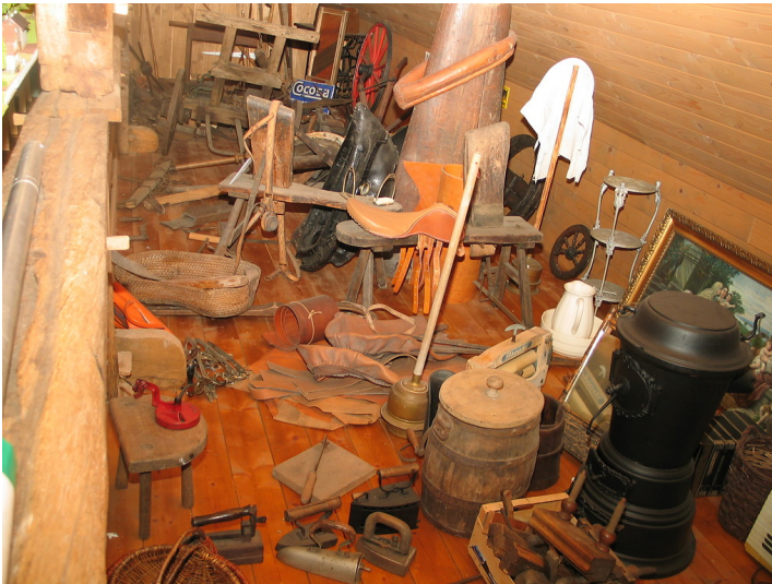
Im Heimatmuseum Schermbeck findet der Besucher viele Exponate, die Zeugnis ablegen für den Lebensalltag der Kleinstädtischen und ländlichen Bevölkerung (2006).