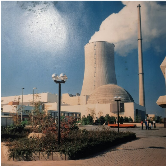
Aufnahme des Kernkraftwerks Mülheim-Kärlich nach dem Abschluss der Errichtungsarbeiten (aus der Druckschrift Nr. D BBR 1363 87 B, Babcock Brown Boveri Reaktor GmbH, 1987). Fotograf/Urheber: unbekannt