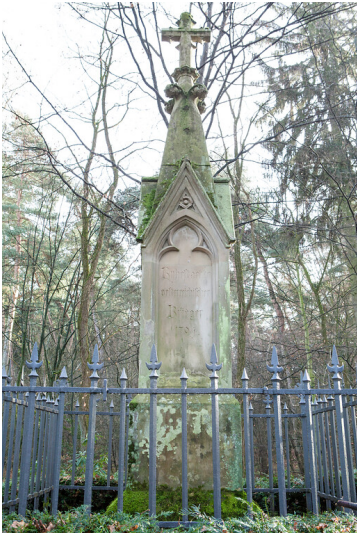
Ehrenmal auf dem Österreichischen Friedhof in Bensberg (2015)