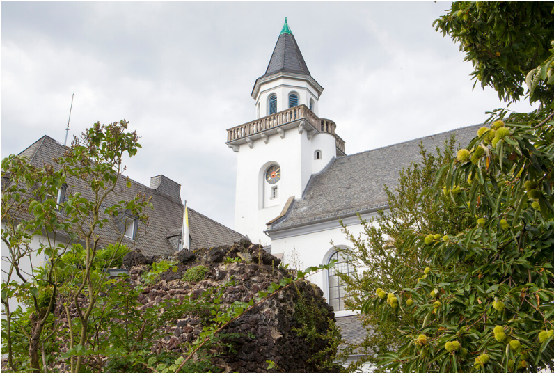
Außenansicht der Wallfahrtskirche auf dem Kreuzberg (2015)