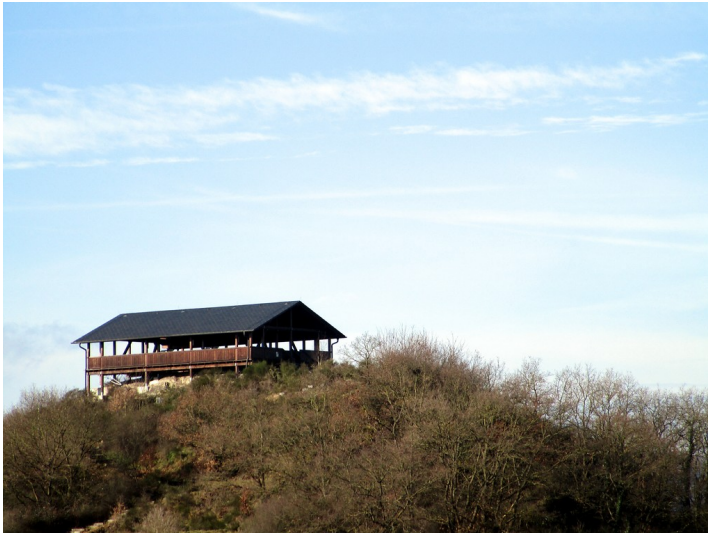
Der Schutzbau über den Mauerresten der spätromischen Befestigung "Römerwarte Katzenberg" bei Mayen, Ansicht vom Parkplatz aus (2015)