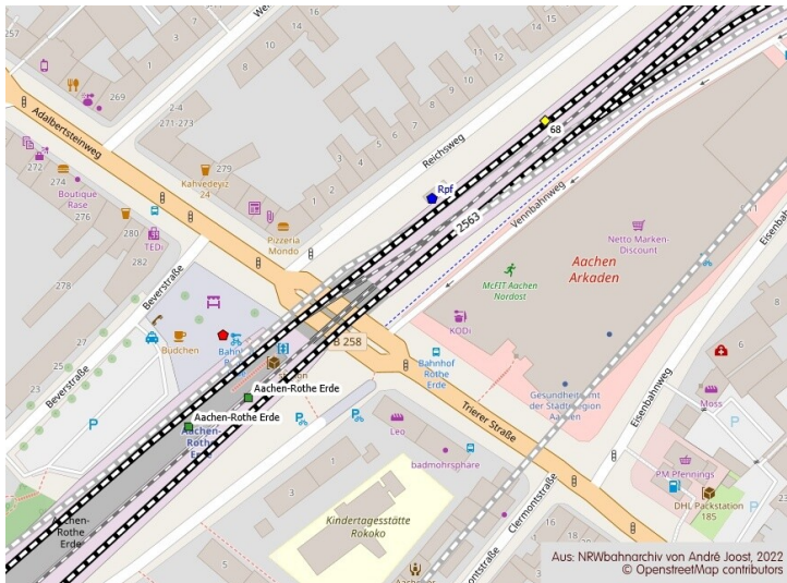
Lage des Stellwerkes Rpf im Bahnhof Aachen-Rothe Erde (2022)