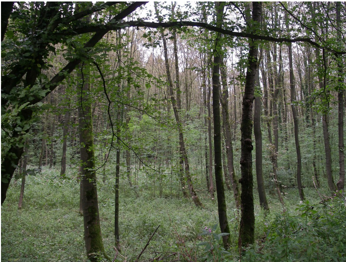
Auenwald an der Strunde