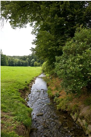
Die Strunde bei Gut Schiff