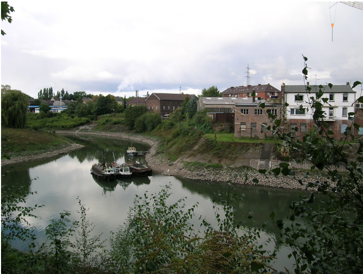
Werfthafen in Duisburg-Ruhrort (2005)