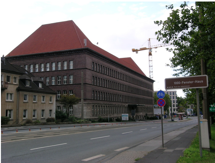
Tausendfensterhaus (Haus Ruhrort) in Duisburg-Ruhrort (2005)