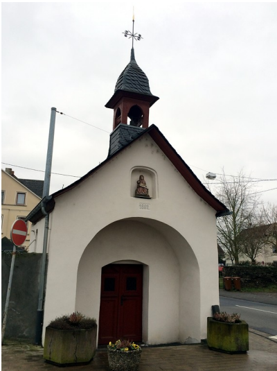
Die Kapelle Sankt Sebastianus in Engers, das so genannte Pestkapellchen in der Bendorfer Straße (2015).