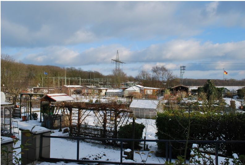
Kleingartenanlage "Unsere Scholle" am Fürmannsheck in Neukirchen-Vluyn (2014)