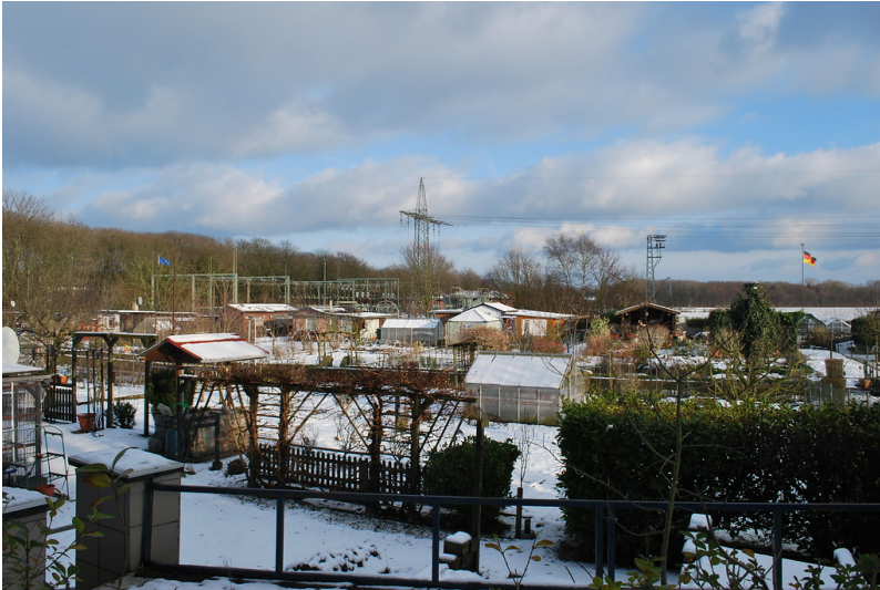
Kleingartenanlage "Unsere Scholle" am Fürmannsheck in Neukirchen-Vluyn (2014)