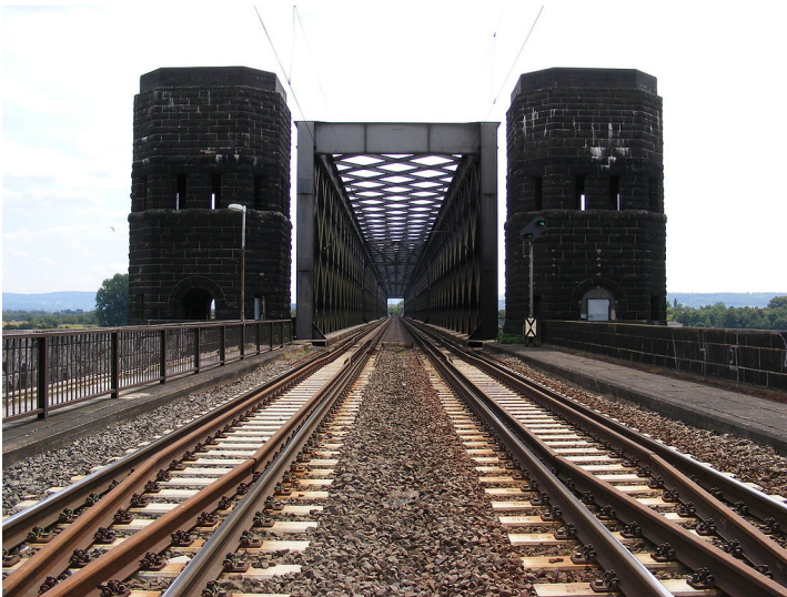
Einfahrt in die Eisenbahnbrücke "Kronprinz-Wilhelm-Brücke" bei Neuwied (2009).