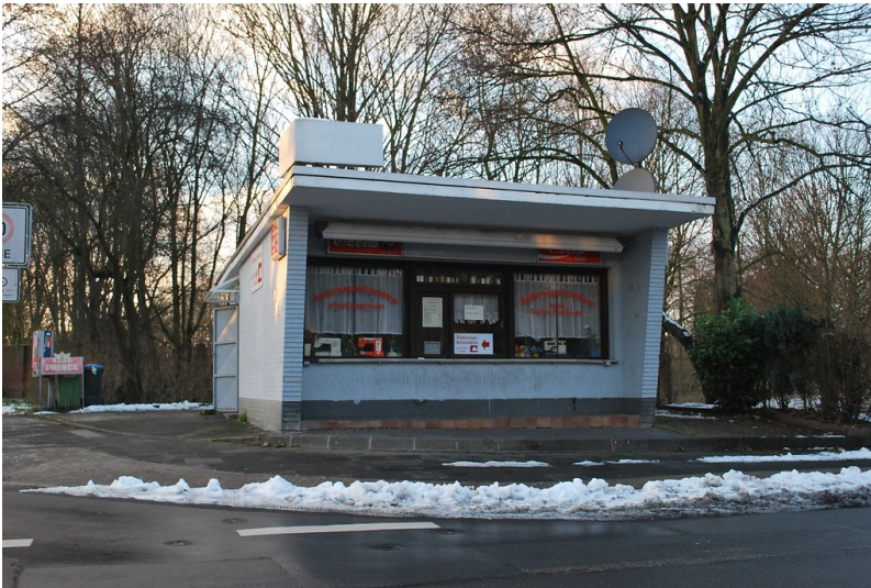
Trinkhalle an der Waldstraße/Hans-Böckler-Straße in Neukirchen-Vluyn (2014)