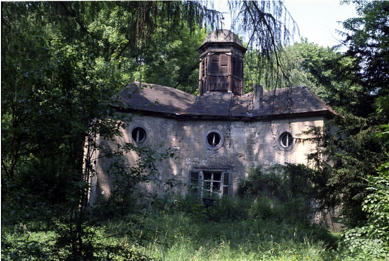
Das spätbarocke Gartenhaus des Sayner Schlossparks.