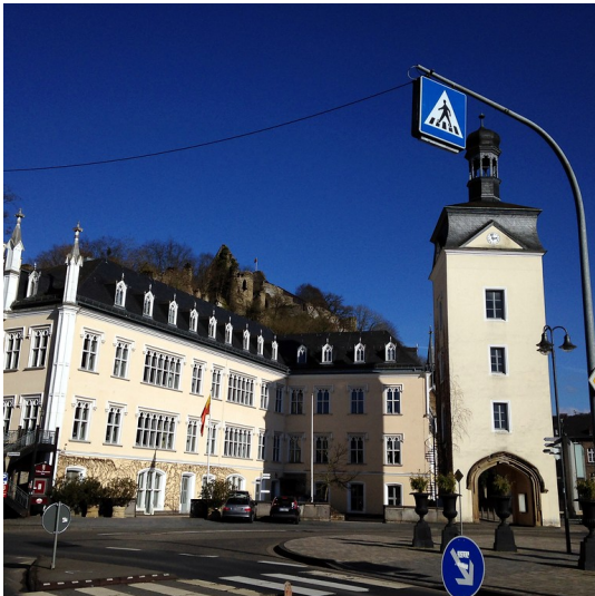
Die Seitenfront des Schlosses und der Schlossturm in Sayn (2015).