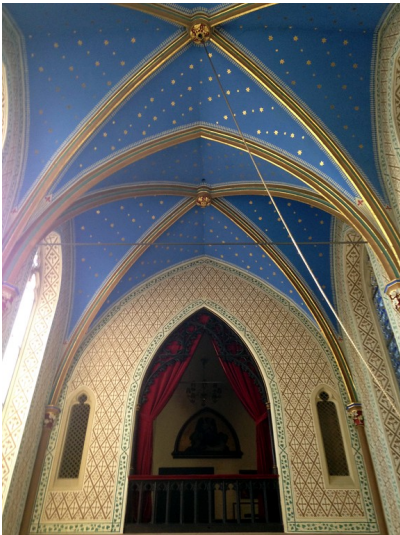
Die Gewölbendecke der Schlosskapelle Sayn (2015).