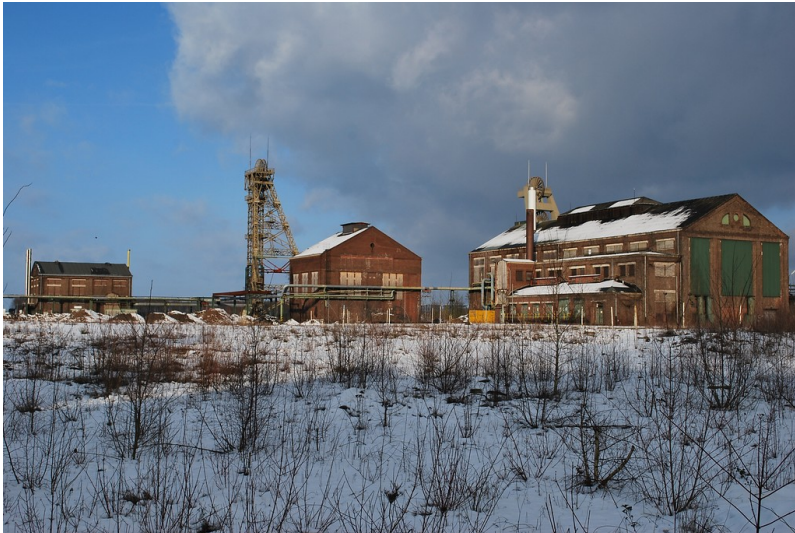
Erhaltene Gebäude der Zeche Niederberg 1/2 in Neukirchen-Vluyn (2014)