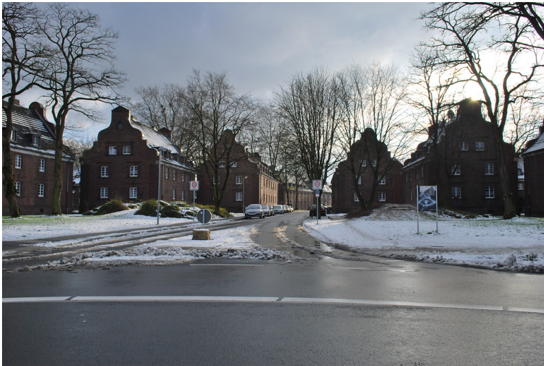
Etzoldstraße in der Zechensiedlung "Neue Kolonie" in Neukirchen-Vluyn (2014)