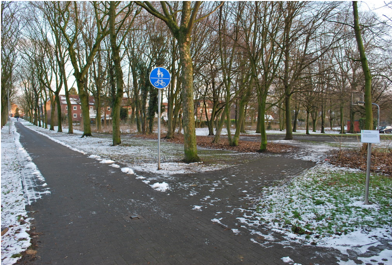
Ehemaliges Barackenlager Industriestraße in Neukirchen-Vluyn (2014)