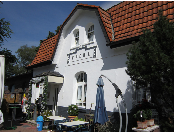
Empfangsgebäude im Kreisbahnhof Baerl, Gleisseite (2012)