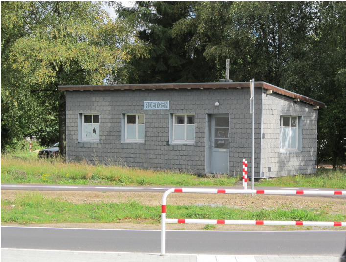
Empfangsgebäude des ehemaligen Bahnhofs Roetgen an der Vennbahn (2011)