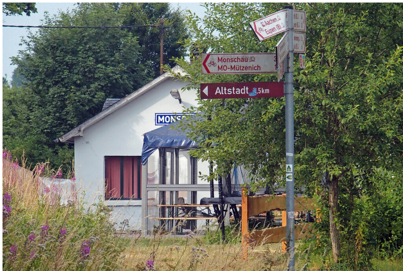
Kiosk am ehemaligen Haltepunkt Monschau (2022)