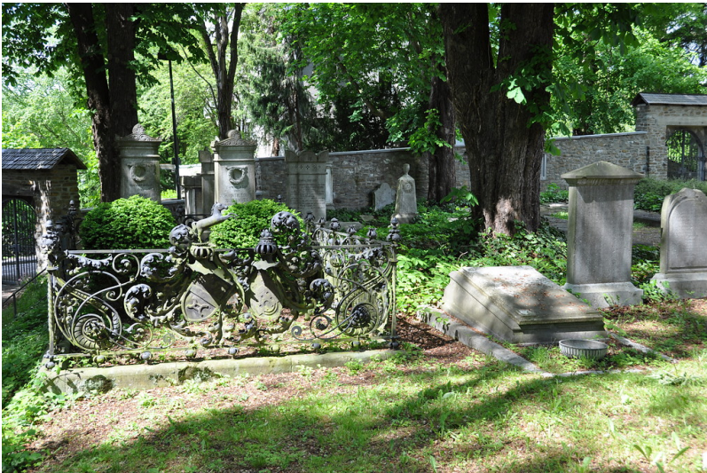
Stolberg, Kupfermeisterfriedhof (2014)