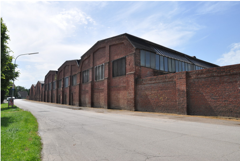
Eschweiler, Werkhallen der ehemaligen Firma W. Dohmen (2014)