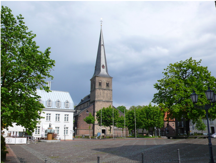
Blick über den Marktplatz Rheinberg auf die Kirche Sankt Peter (2008).