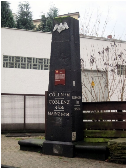
Das Bild zeigt den preußischen Meilenstein in der Koblenzer Straße in Sinzig (2014).