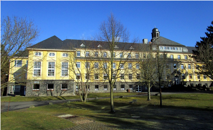
Jugendhilfezentrum Bernardshof bei Mayen, Frontansicht des Hauptgebäudes (2015)