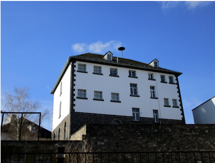
Altes Arresthaus in Mayen, rückwärtige Ansicht (2015)