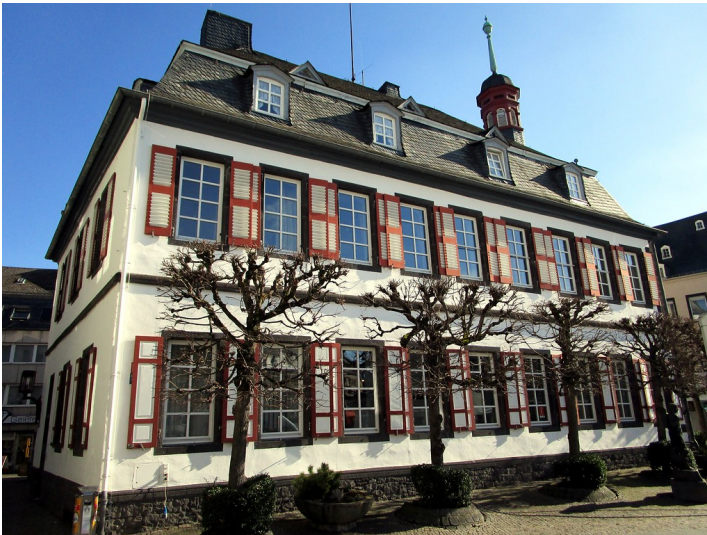
Das Alte Rathaus am Marktplatz in Mayen (2015)