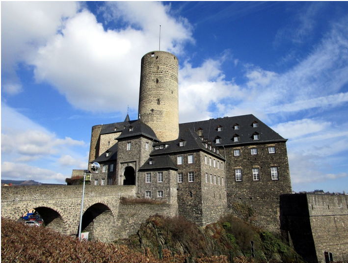
Genovevaburg Mayen, Blick auf die Ostburg (2015).