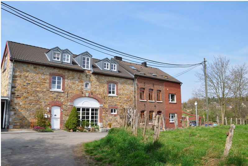
Bocksmühle (2014)